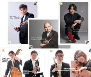
パーティで配布したフォトカード