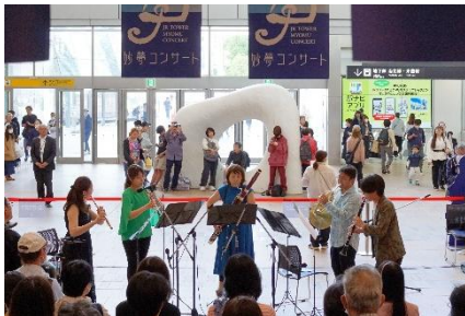
札幌駅での「JRタワー妙夢コンサート」に出演。