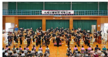
公立学校教職員互助会公演事業(雨竜) (指揮:下野竜也)