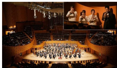
Kitaraあ・ら・かると(指揮:水戸 博之) 札幌新川高校吹奏楽部トランペットメンバーと共演