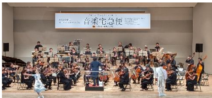
「クロネコファミリーコンサート」(旭川) (指揮:飯森範親)