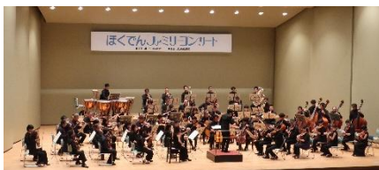
「ほくでんファミリーコンサート」(伊達) (指揮:出口大地)