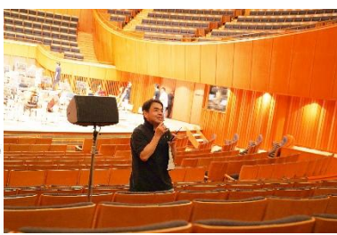
練習見学会の参加者に向け指揮者がトーク(9月:下野竜也)

札幌会員の参加イベントとして、「ニューイヤーコンサート&パーティ」を開催。楽団員・指揮者との交流のきっかけとしてフォトカードを配布し、サインを集めるゲーム要素を加え、来場の皆さまにご好評いただきました。