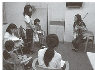
ピリッキースクールで子どもたちが音楽を学んでいます。